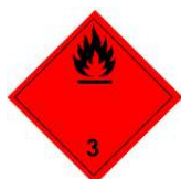
nr 3 Czarny lub biały nadruk na czerwonym tle.

g) Kod ograniczeń przewozu przez tunele : D/E